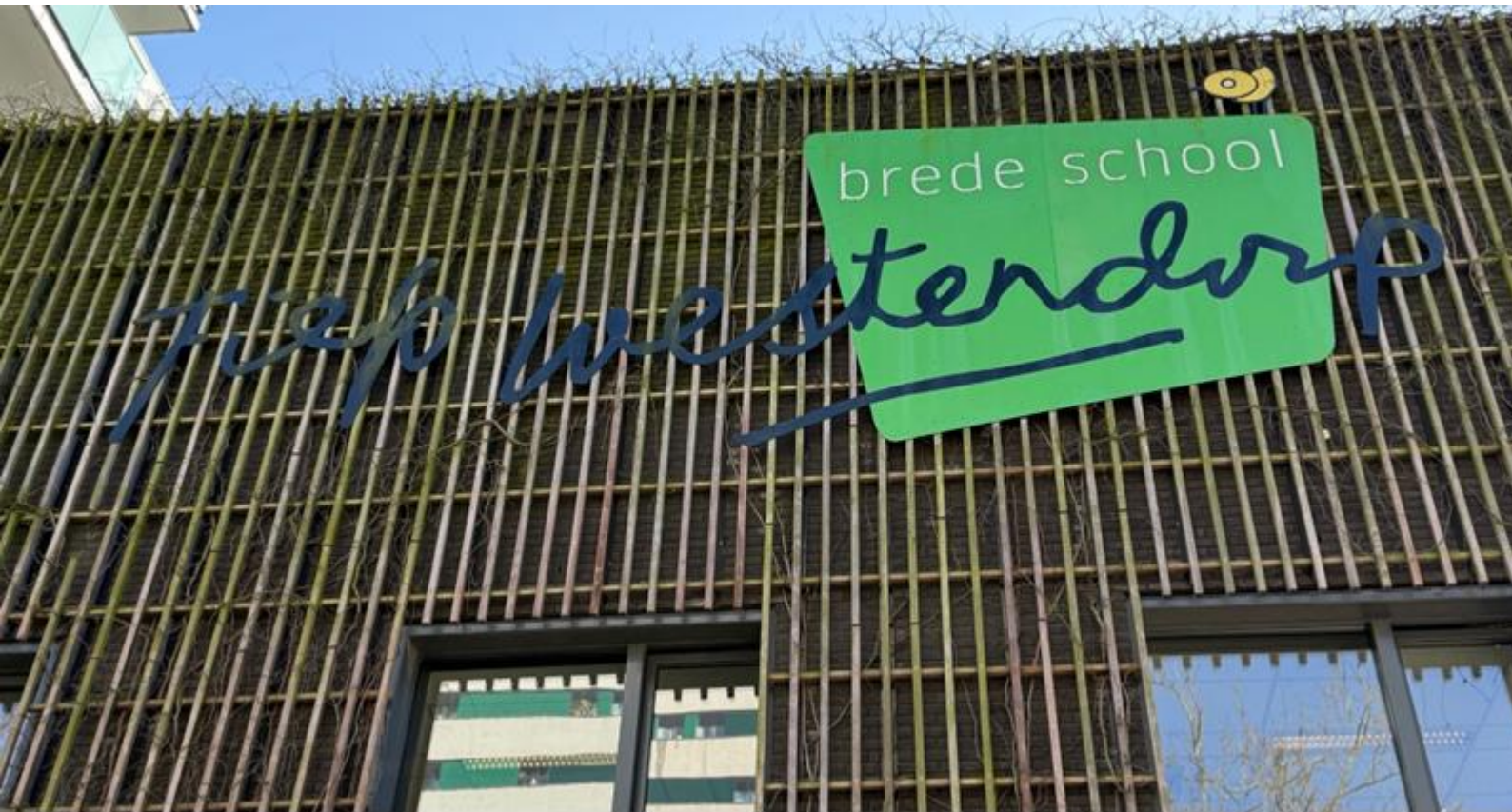
Zijgevel van de school in maart 2025

Onderwijsgeschillen 070-3861697 info@gcbo.nl